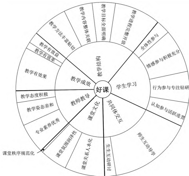
图1 师范生眼中的“好课”特征编码层次分布

借助Nvivo11plus软件将编码数据可视化,生成师范生眼中“好课”特征的编码层次分布图,如图1所示。该图以“好课”为圆心,6个一级节点为内环,统括的19个二级节点为外环,每一节点所占区域的面积大小代表该节点的参考点数量,直观展示师范生眼中“好课”特征的编码层级关系和各节点所占比重,呈现“好课”在教学结构等六大维度的基本形态。但仅有经验数据难以理解好课真貌、揭示好课本质,因此,基于编码结果回归课堂原点,以教学本质观为理论分析框架,立足课堂教学的活动—实践性、交往—社会性、文化—价值性三大基本特点,运用关系思维分析学生、教师、课程与课堂文化间互动生成的复杂关系 [17]110 ,结合教育高质量发展的时代背景,诠释自下而上扎根生成的“好课”基本特征。